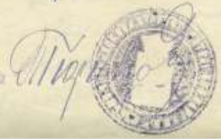
Сведения о числе нижних чинов, уволенных в отпуск за август 1916 г., по Больше-Читканскому селению. 30 августа 1916 г. Рукопись. Подлинник. Ф.187. Оп.2. Д.109. Л.32,33.